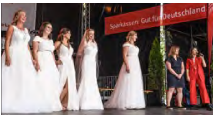
Modenschau auf der Sparkassen-Bühne