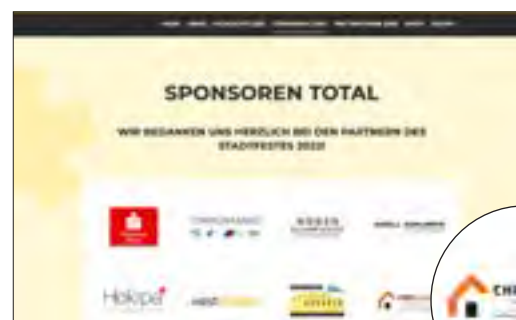
Logo auf der Sponsorensite der Website mit Verlinkung